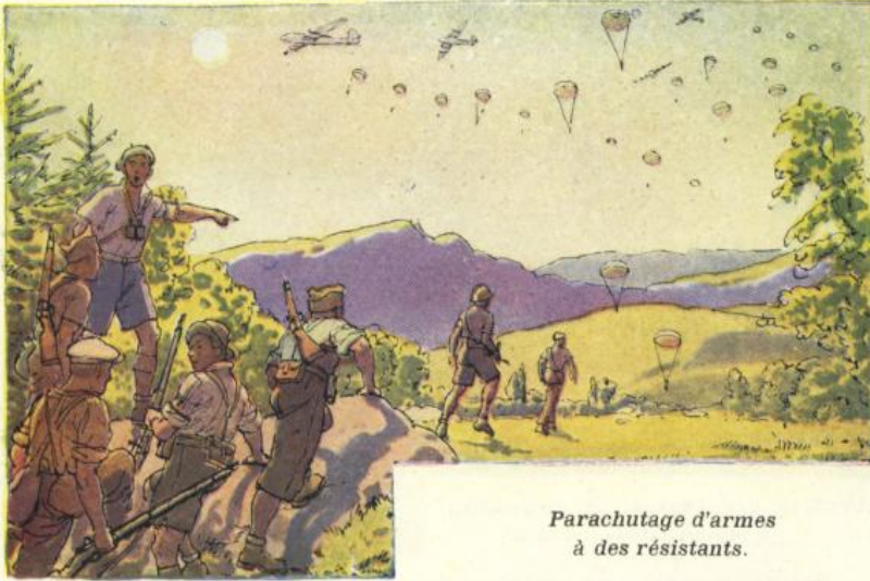
Parachutage d'armes à des résistants.

Dans quelle sorte de pays la scène se passe-t-elle? Quels sont ces hommes? (des résistants ou « maquisards » : expliquer leur rôle). Sont-ils vêtus d'un uniforme? Pourquoi les avions anglais lâchent-ils des parachutes? Expliquer que les tubes accrochés aux parachutes étaient remplis d'armes et de munitions.