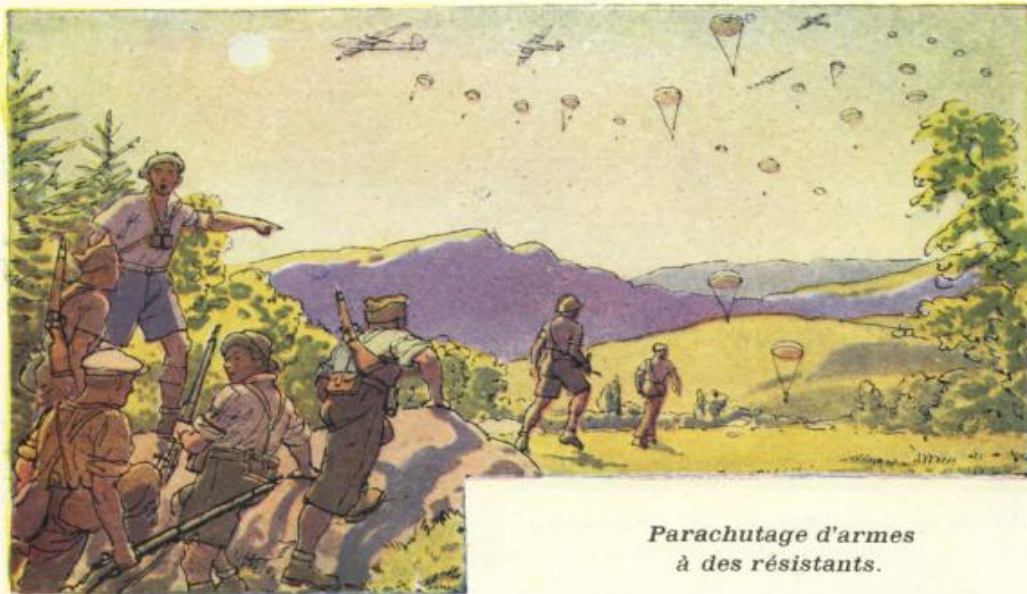
Parachutage d'armes à des résistants.

Dans quelle sorte de pays la scène se passe-t-elle? Quels sont ces hommes? (des résistants ou « maquisards » : expliquer leur rôle). Sont-ils vêtus d'un uniforme? Pourquoi les avions anglais lâchent-ils des parachutes? Expliquer que les tubes accrochés aux parachutes étaient remplis d'armes et de munitions.