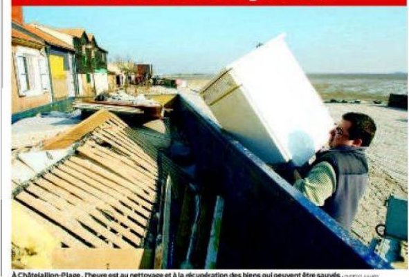
À Châtelailon-Plage, l'heure est au nettoyage et à la récupération des biens qui peuvent être sauvés. PHOTOFESTIVAL