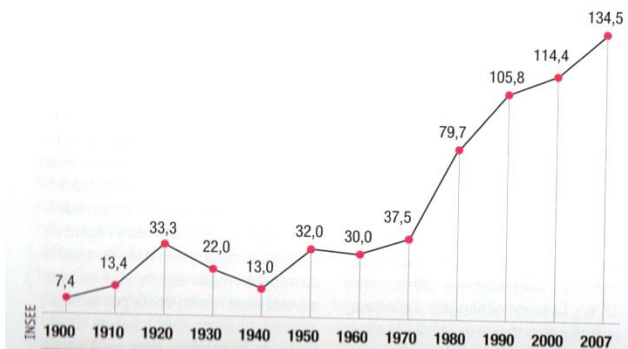
Evolution des divorces en milliers